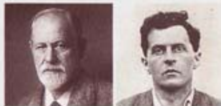
Sigmund Freud versus Ludwig Wittgenstein