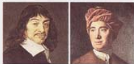
Cartesio a confronto con David Hume