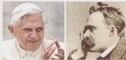
Papa Ratzinger a confronto con Nietzsche

molti dubbi sulla democrazia perché, come diceva Churchill, è il sistema di governo meno peggiore. Ma è anche il trionfo della mediocrità, aggiungo io. Blocca la genialità».